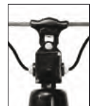
Alu-Kabel-Box mit Seilaufhänger ABS